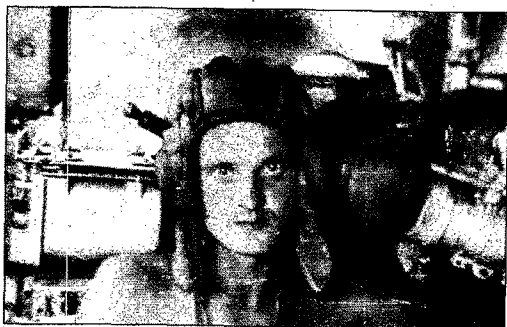
« L'Afghanistan m'attirait comme un abîme inconnu. Je savais que cela allait faire chavirer ma vie. »