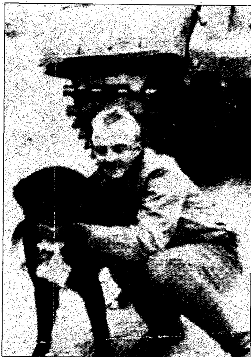
« Le chien était notre mascotte, on l'appelait le Gros. Je ne sais pas ce qu'il est devenu. »