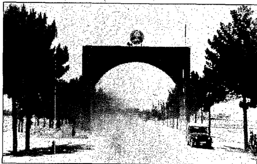
« Là-bas, j'ai vu des montagnes pour la première fois de ma vie. C'était très beau, vu d'hélicoptère. »

Regardez ces trois années d'images, nues, maladroitement floues. Regardez-les. À chaque photo, le visage de Dimitri vieillit plus vite que le temps. Dimitri est un vétéran d'Afghanistan.