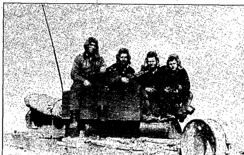
« On nous a remis deux paires de bottes, une gourde et des pantoufles pour l'hôpital. J'ai compris que ce serait long. »