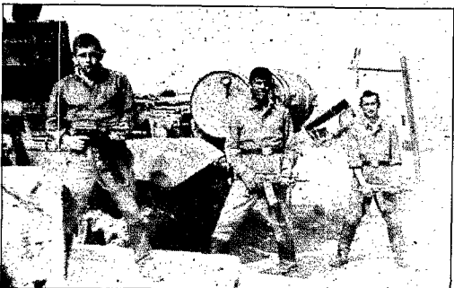
« "Y a-t-il des volontaires ? ", a demandé l'officier. On a tous fait un pas en avant. On ne savait pas. »