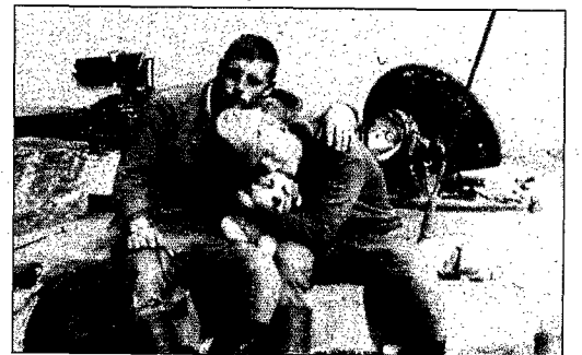
« C'était un 15 février, le jour de mes 20 ans. Un obus est tombé à quinze mètres de moi. Bon anniversaire ! »