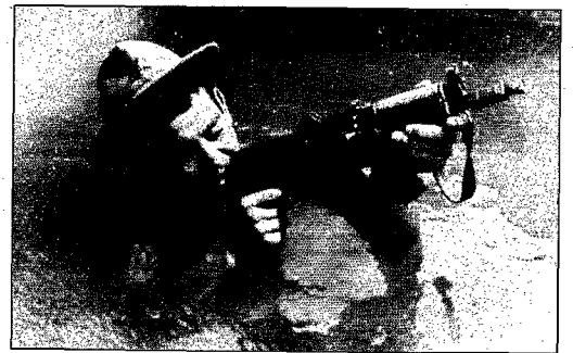
« Dès la première embuscade, Vladimir a eu la tête éclatée par une balle. »