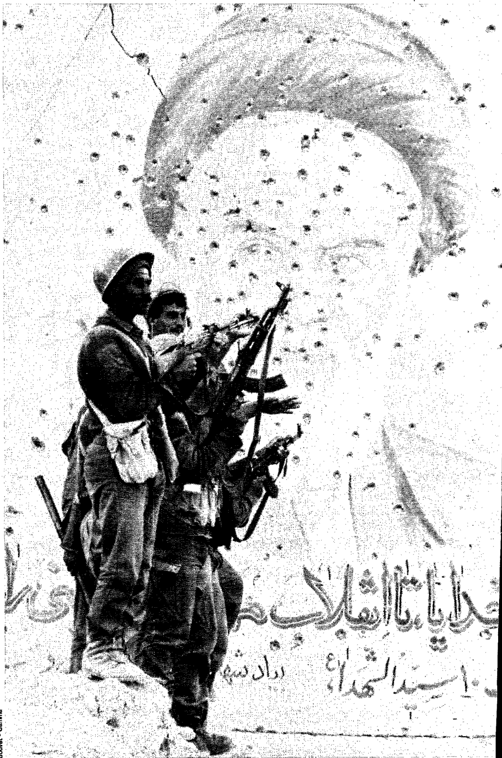
BOUVER - GAMMA

Ici, la vie a toujours été aussi volatile que ce talc beige qui enveloppe notre véhicule sur son