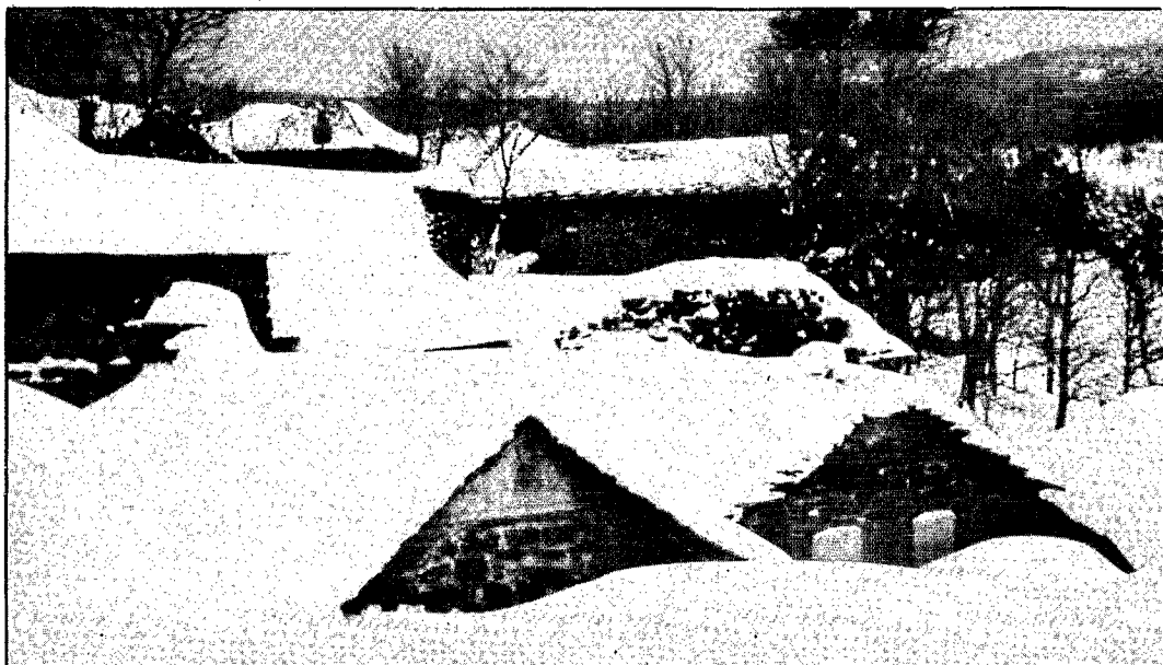
Une ferme ensevelie dans la Margeride Rester ? « Oui, à condition de rester célibataire... »

Là-bas, quand la « fraîche » sournoise étouffe les maisons, coupe les routes et l'électricité, les enterrés vivants n'ont plus qu'un espoir : le printemps