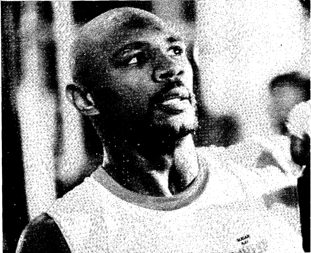
Marvin Hagler à l'entraînement

L'Amérique a compris l'enjeu ; et elle attend. Marvin Hagler « the Marvelous », 32 ans, 66 combats donc 56 victoires par K.O., champion du monde des poids moyens, vaincu depuis onze ans, l'homme qui n'a jamais plié le genou sur un ring. Contre Sugar Ray Leonard, « le Sucre », 30 ans, 30 combats dont 24 par K.O., ancien champion du monde des légers, puis des welters, champion olympique en 1976, le corps d'un danseur et l'intelli-