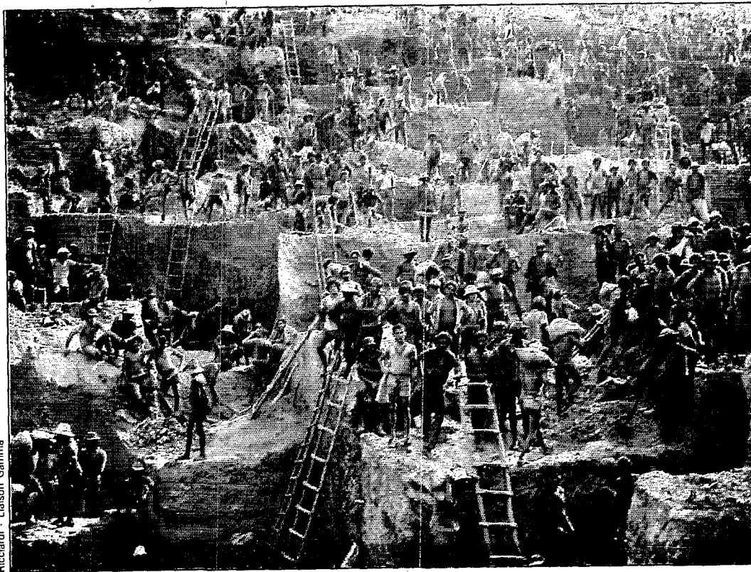
Ricciardi - Liaison Gamma

Pour échapper à la misère, ils se ruent par milliers vers l'enfer, en plein cœur de l'Amazonie... Là-bas, les pépites se ramassent à la pelle