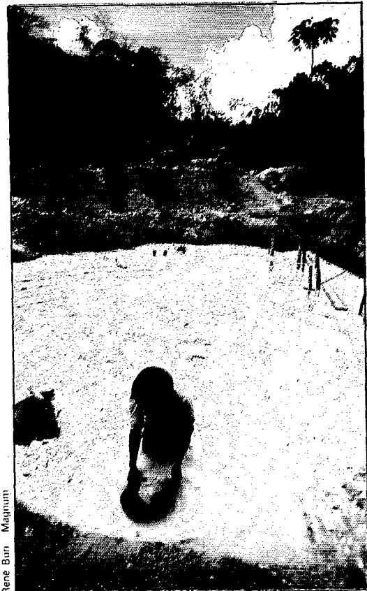
René Burr - Magnum